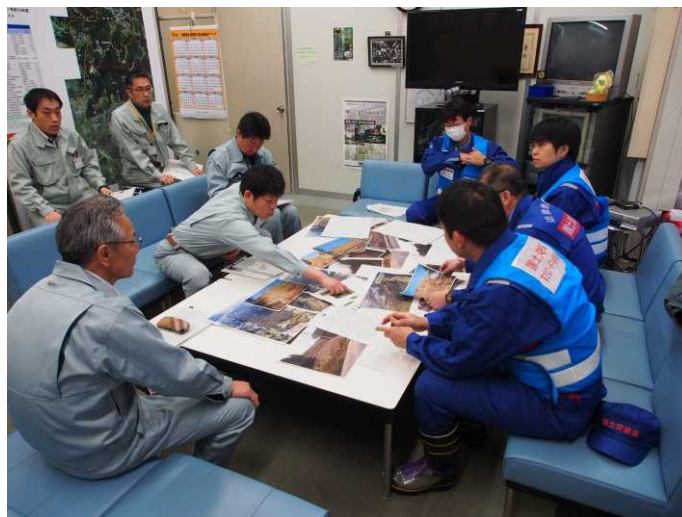
池田土木事務所における概要説明