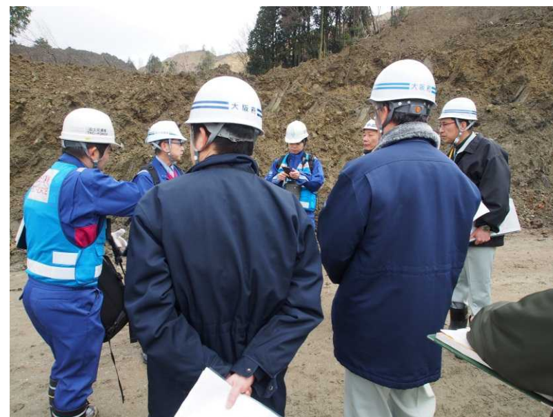
調査所見の説明、意見交換