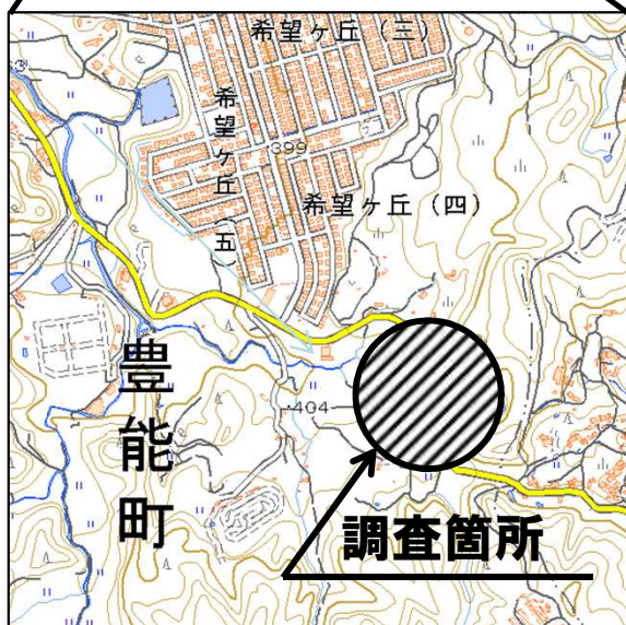
位置図: 国土地理院電子国土Webより