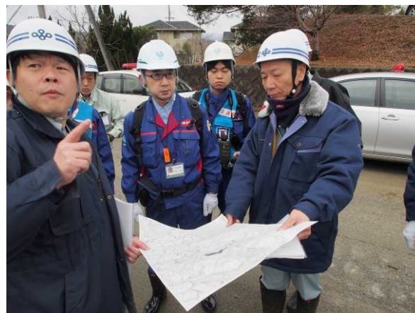
現地における状況説明