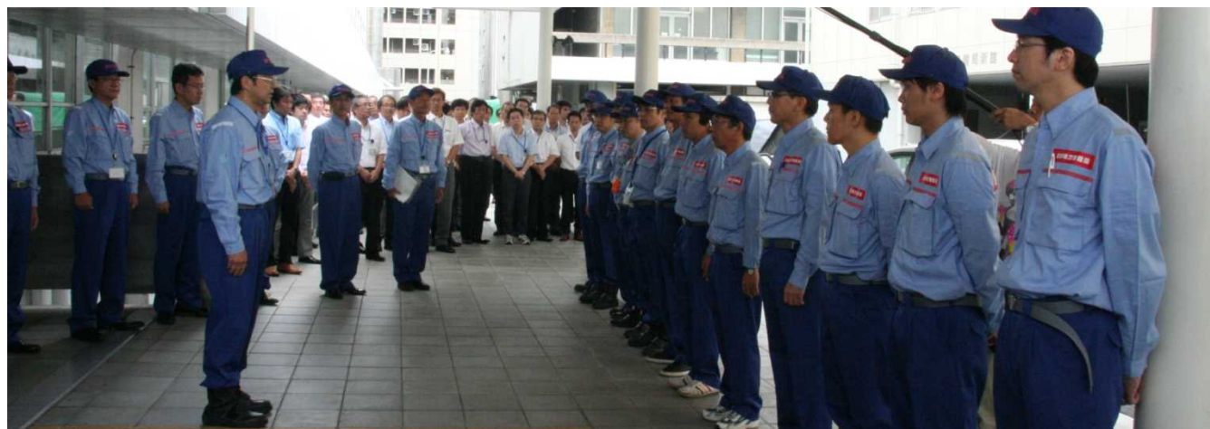
出陣式に集結した近畿地方整備局のTEC-FORCE 13名