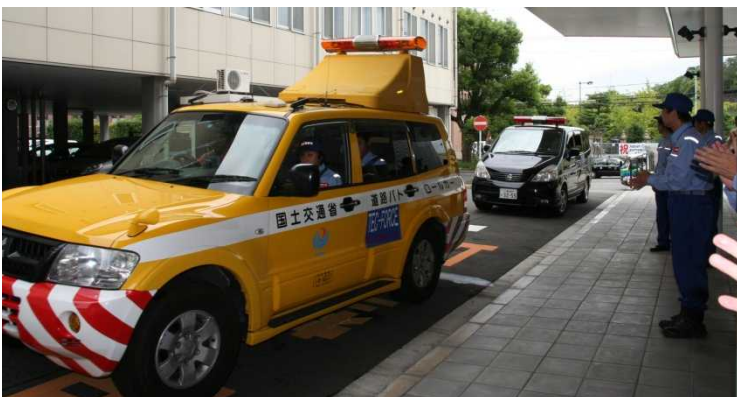
島根県浜田県土整備事務所に向け出発