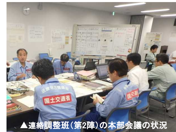
▲連絡調整班(第2陣)の本部会議の状況