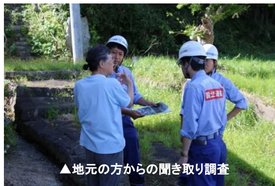
▲地元の方からの聞き取り調査