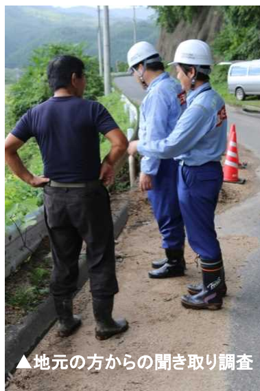
▲地元の方からの聞き取り調査