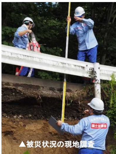
▲被災状況の現地調査