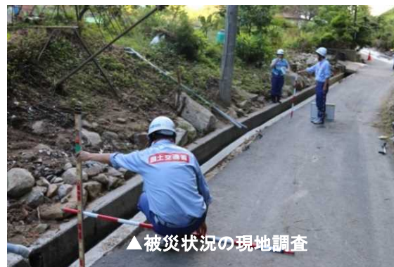
▲被災状況の現地調査