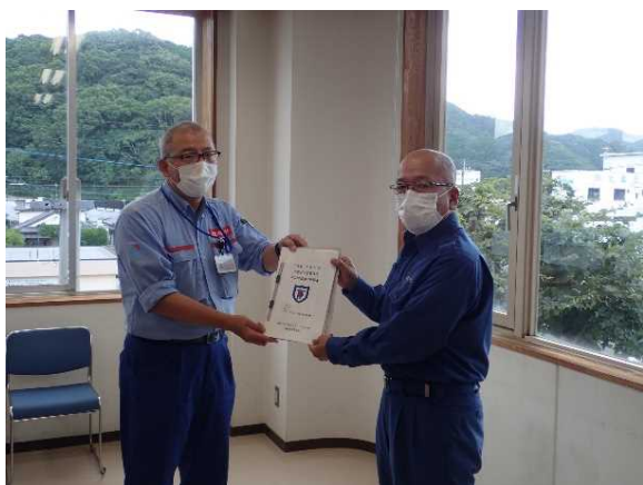
7/28【河川班】調査結果を報告(芦北町)