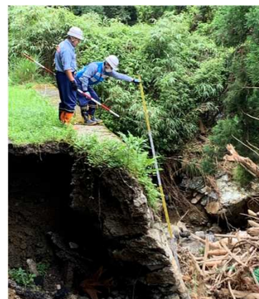
7/28【道路班】被害状況調査(芦北町)