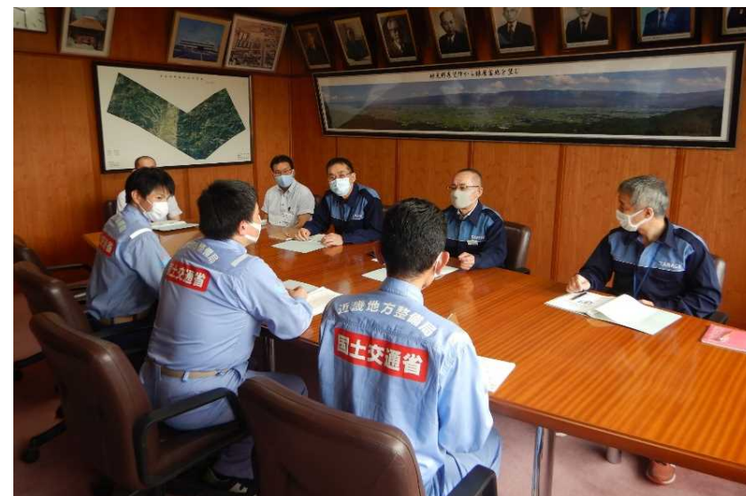
7/28【河川班】調査結果を報告(多良木町)