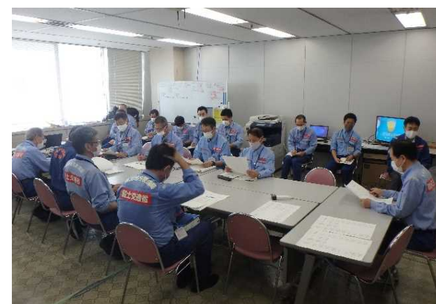
7/28【連絡調整班】各地整との情報共有会議