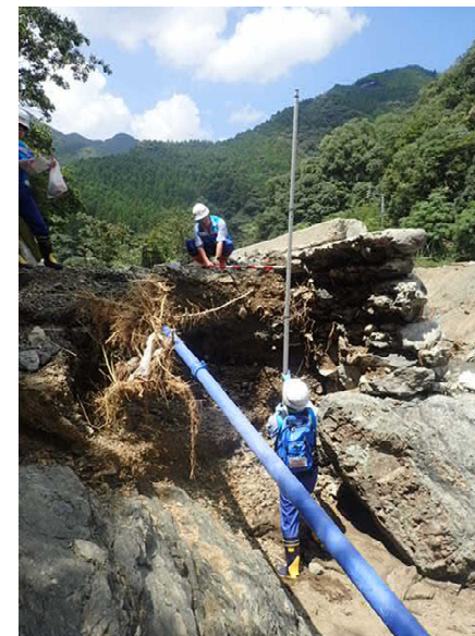
7/30【道路班】被害状況調査(八代市)