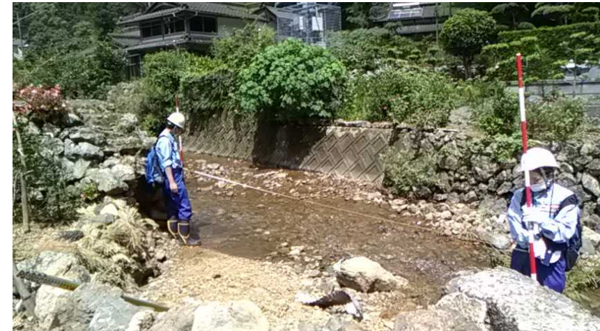
7/30【道路班】被害状況調査(芦北町)