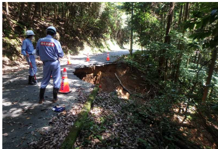
7/30【道路班】被害状況調査(芦北町)