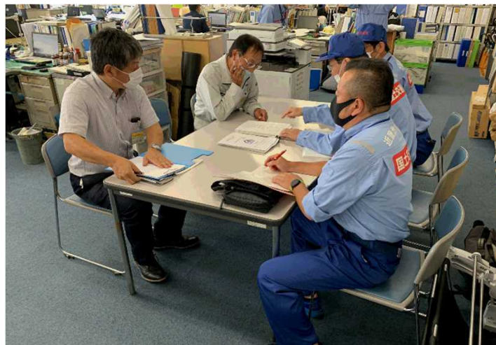
8/3【河川班】調査結果を報告（八代市）