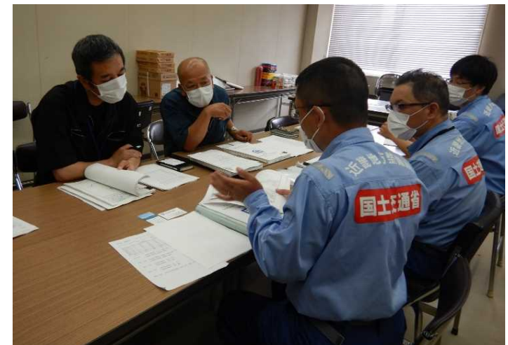
8/3【道路班】調査結果を報告（芦北町）