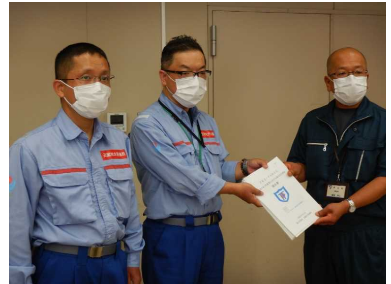
8/3【道路班】調査結果を報告（芦北町）