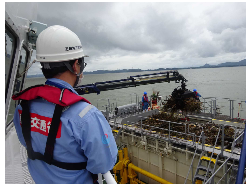
7/14 【港湾班】海洋環境整備船での海面漂流物回収確認