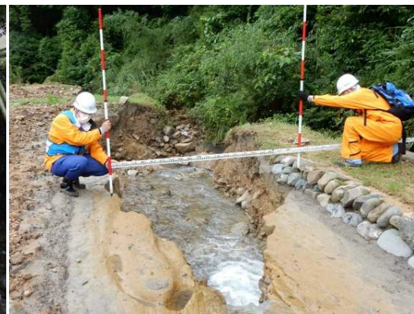
7/15 【河川班】被害状況調査(芦北町)