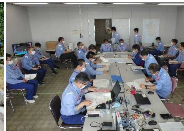
【連絡調整班】各地整隊員との調整会議