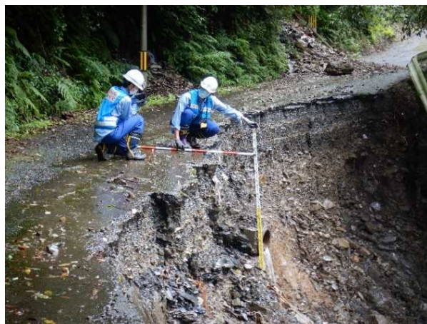
7/15 【道路班】被災状況調査(八代市)