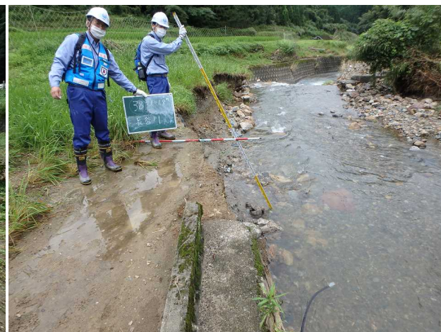
7/16 【河川班】被害状況調査(芦北町)