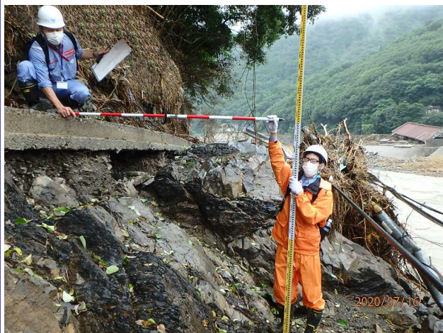
7/16 【道路班】被災状況調査(八代市)