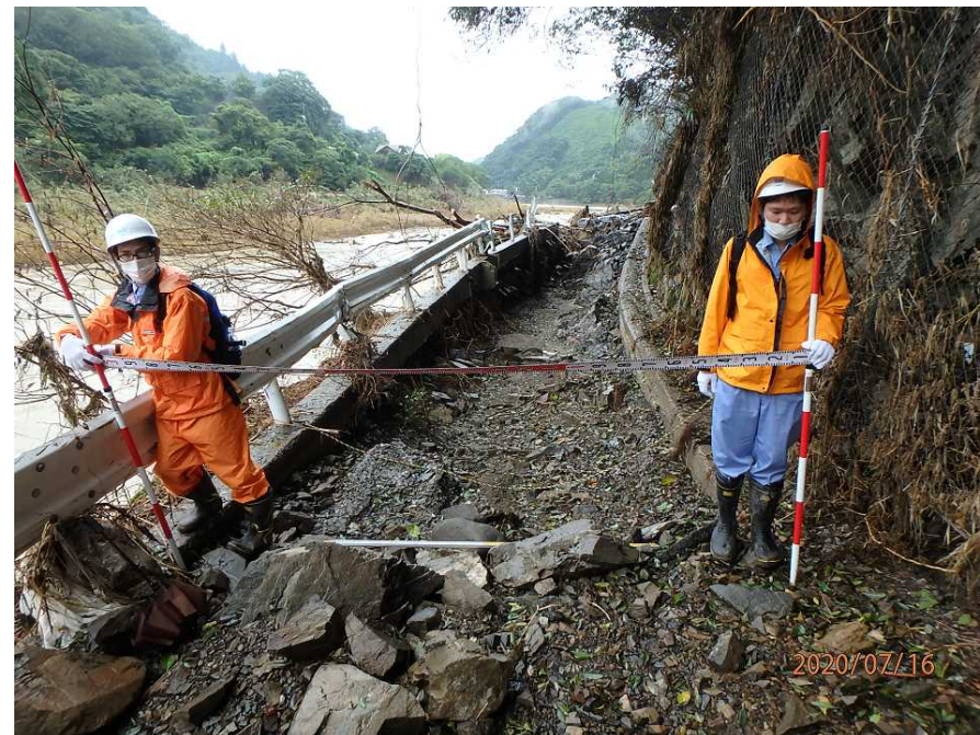
7/16 【道路班】被災状況調査(八代市)