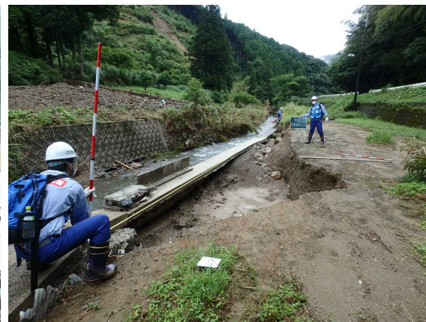
7/16 【河川班】被害状況調査(芦北町)