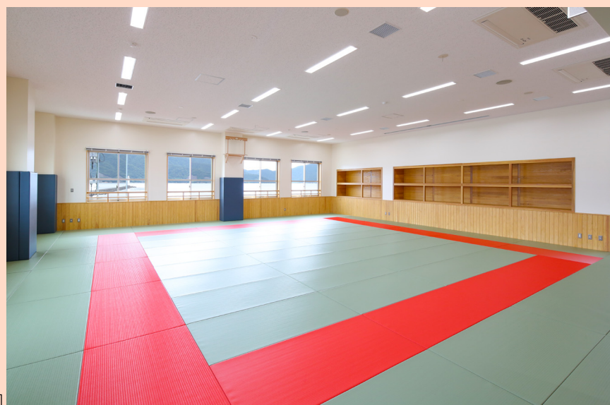
[2階武道場兼会議室]