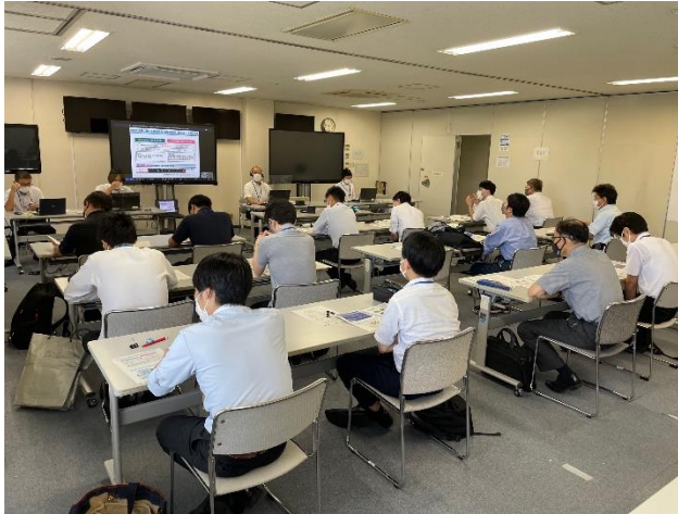
令和4年度近畿地区官庁施設保全連絡会議の様子

コロナ禍の関係で昨年度は、 WEB開催併用としましたが、今年度も同様に行う予定です 。今年はコロナ過も落ち着いているので、 是非直接会場へお越し頂き 、色々ご相談も受け付けたいと思います。お越し頂けない方には、WEB(Teams)にて参加してくださいようお願いします。