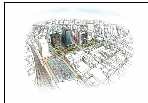
シビックコア地区の全景