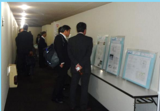
▲ パネル展示の様子