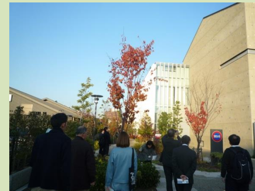
▲ さ かい 利 晶 の 杜 ▲ 施 設 見 学 会 の 様 子 ▲

「公共建築の日(11月11日)」及び「公共建築月間(11月)」に合わせて、(一社)公共建築協会近畿地区事務局の主催、近畿地方協力支援会議(近畿地方整備局、府・県・政令市で構成)の後援で、11月14日及び28日にイベントを行いました。