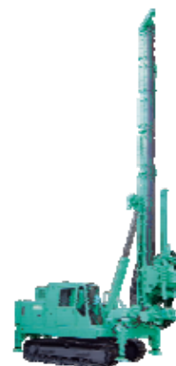
地盤改良工使用機械