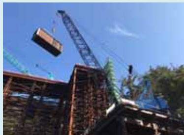
橋げた荷上げ状況