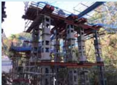
ベント設備組立完了

先月でベント設備の基礎杭～ベント設備本体の組立まで完了し、10月末から橋げたの架設が始まりました。橋げたは当社の和歌山工場からトレーラーにて陸上輸送し、現場へ搬入します。搬入した橋げたは中段栈橋の120t吊クローラークレーンで上段栈橋まで荷上げし、100t吊クローラークレーンにて架設します。架設は11月中頃までに完了します。その後、橋げたまわりの足場組立、ベント設備の解体、道路の基礎部分となる床版コンクリートの打設作業と進めていきます。