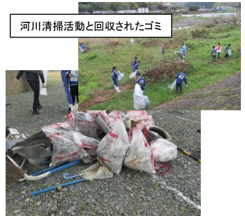
河川清掃活動と回収されたゴミ

いただいた一般利用者の視点によるご意見ご感想は、河川管理を行ううえでの貴重な情報とし、一人でも多くの方々に河川愛護の気持ちを持っていただけるよう努めていきます。