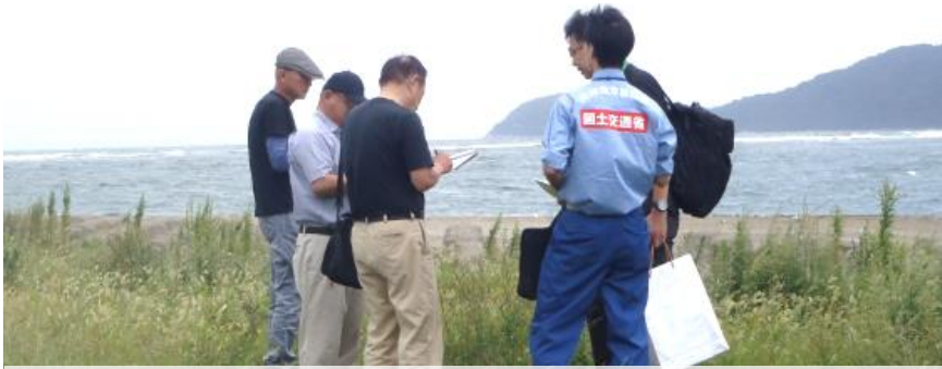
【由良川河口付近での川の通信簿アンケート調査の様子】

河川空間（一般利用がなされる施設とその周辺の河川環境）の現状について、利用者（地元住民や市民団体の方々）を対象にアンケート調査を実施し、利用者の視点から満足度を評価するものです。各点検項目を評価した上で総合評価を5段階で行い、良好な河川空間の保全、整備に繋げていくものです。