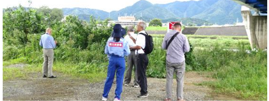
【音無瀬橋付近での川の通信簿アンケート調査の様子】