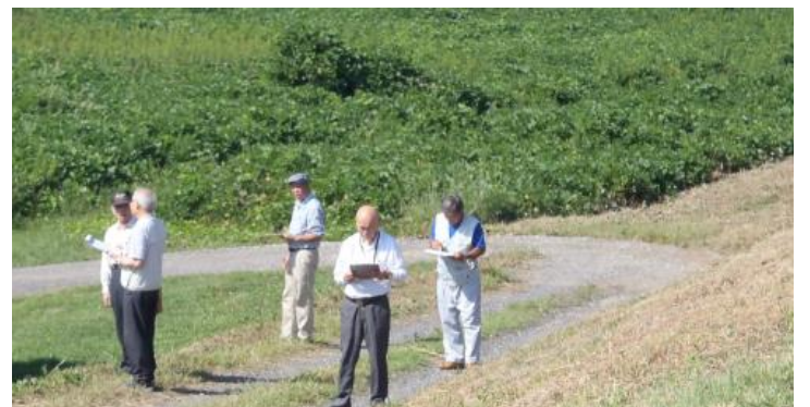
【水辺の楽校付近での川の通信簿アンケート調査の様子】