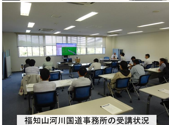
福知山河川国道事務所の受講状況