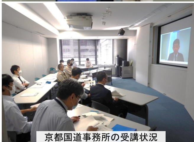
京都国道事務所の受講状況