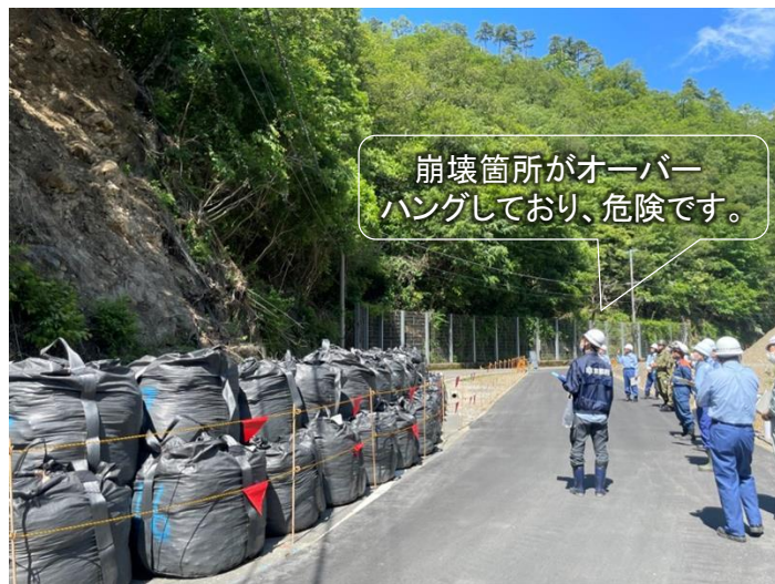
法面对策工事実施箇所（綾部市睦寄町地内）