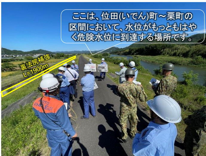
由良川右岸46.2k地点（綾部市栗町地内）