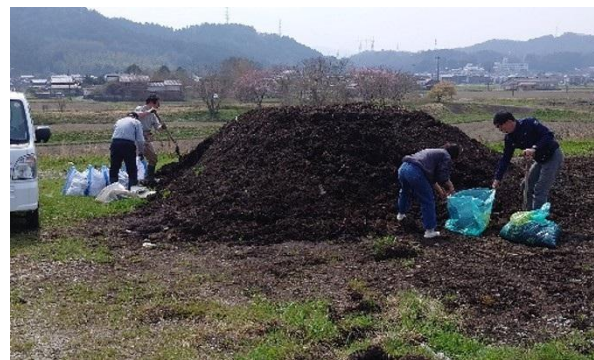
堆肥置場での堆肥採取の状況