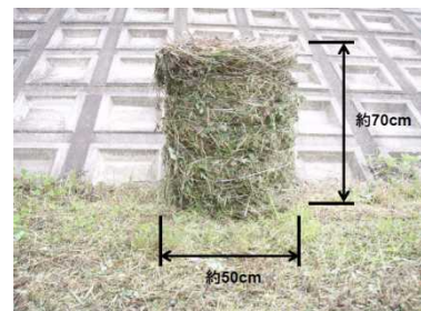
梱包した刈草のイメージ