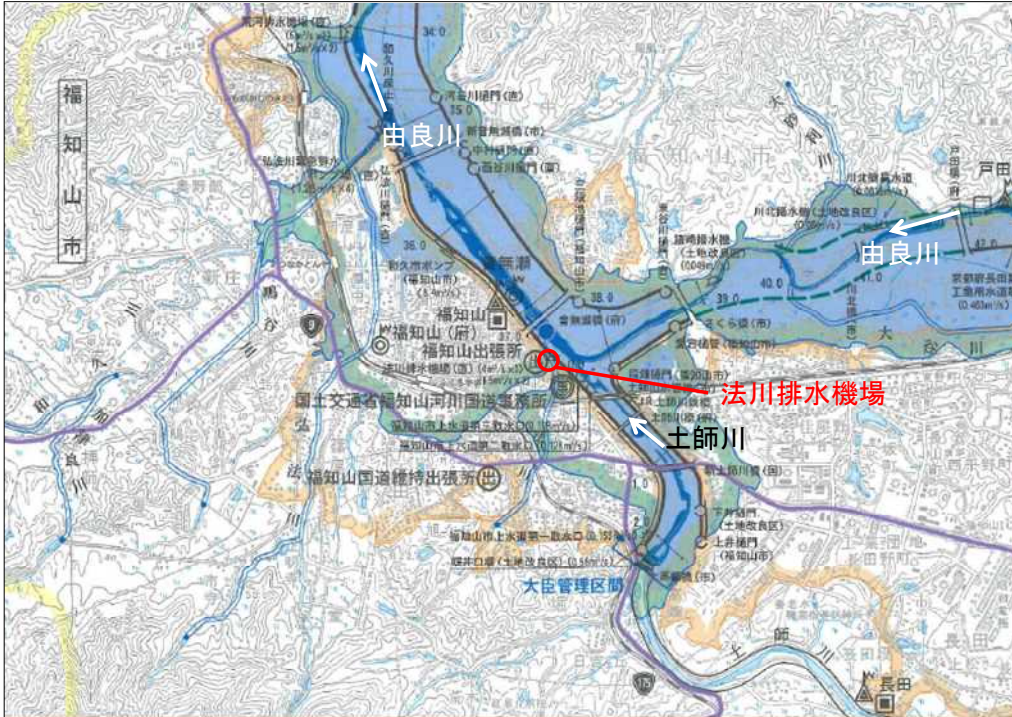
法川排水機場の位置図