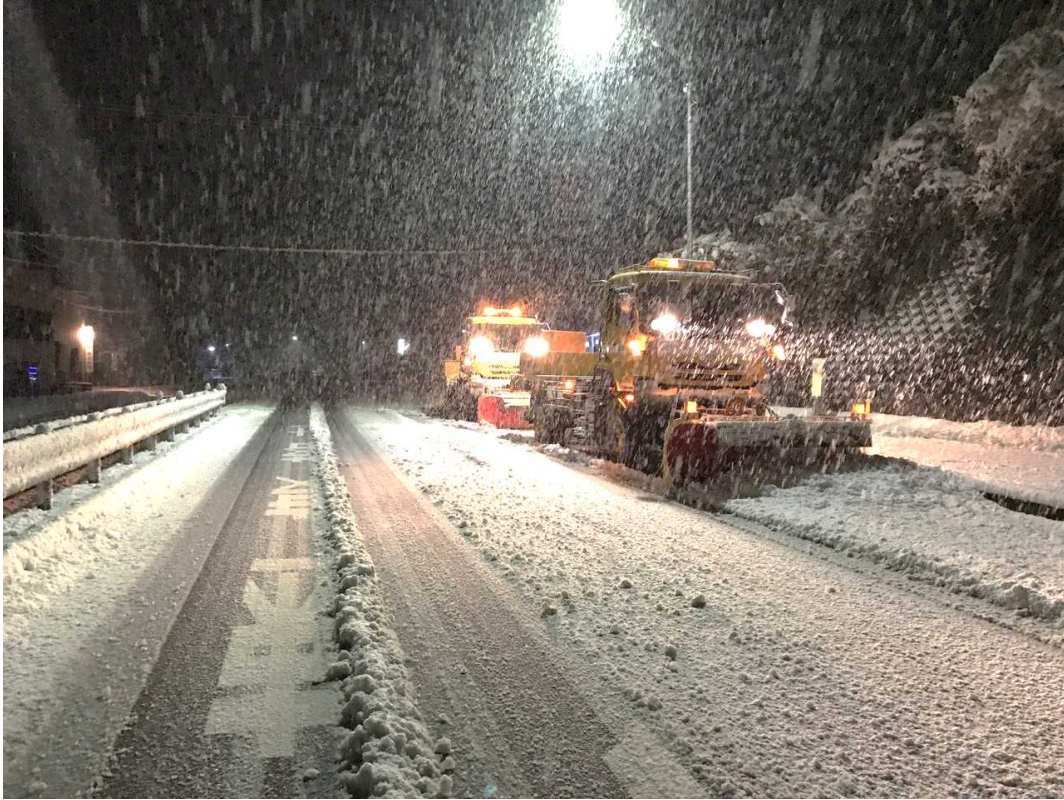
除雪トラックによる除雪作業 (国道 27 号 京都府舞鶴市余部上)