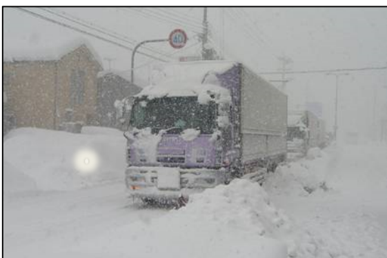
立ち往生車両による渋滞