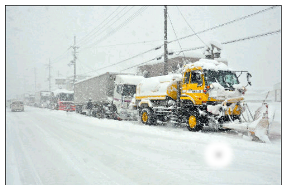
除雪トラックでの牽引による立ち往生車両の移動