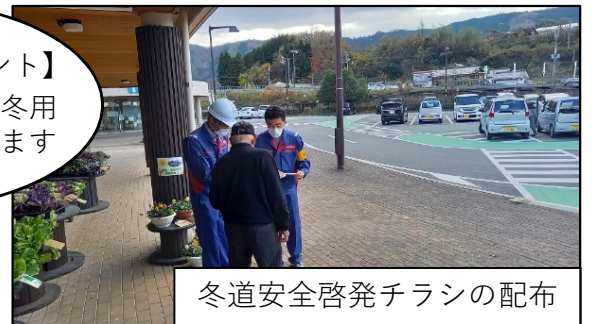
冬道安全啓発チラシの配布