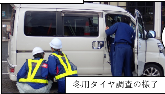
冬用タイヤ調査の様子