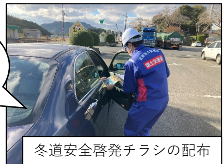
冬道安全啓発チラシの配布