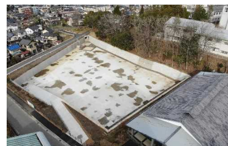
桃池調整池新設(福知山市)