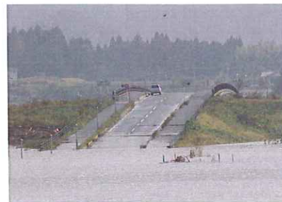
新車瀬橋(福知山市大江町河守)