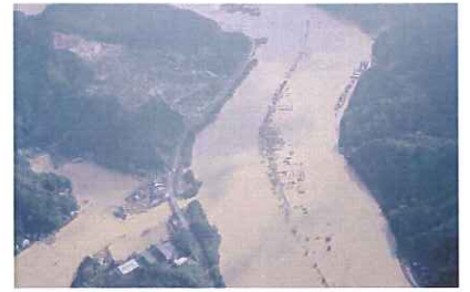
舞鶴市岡田由里・桑飼下付近