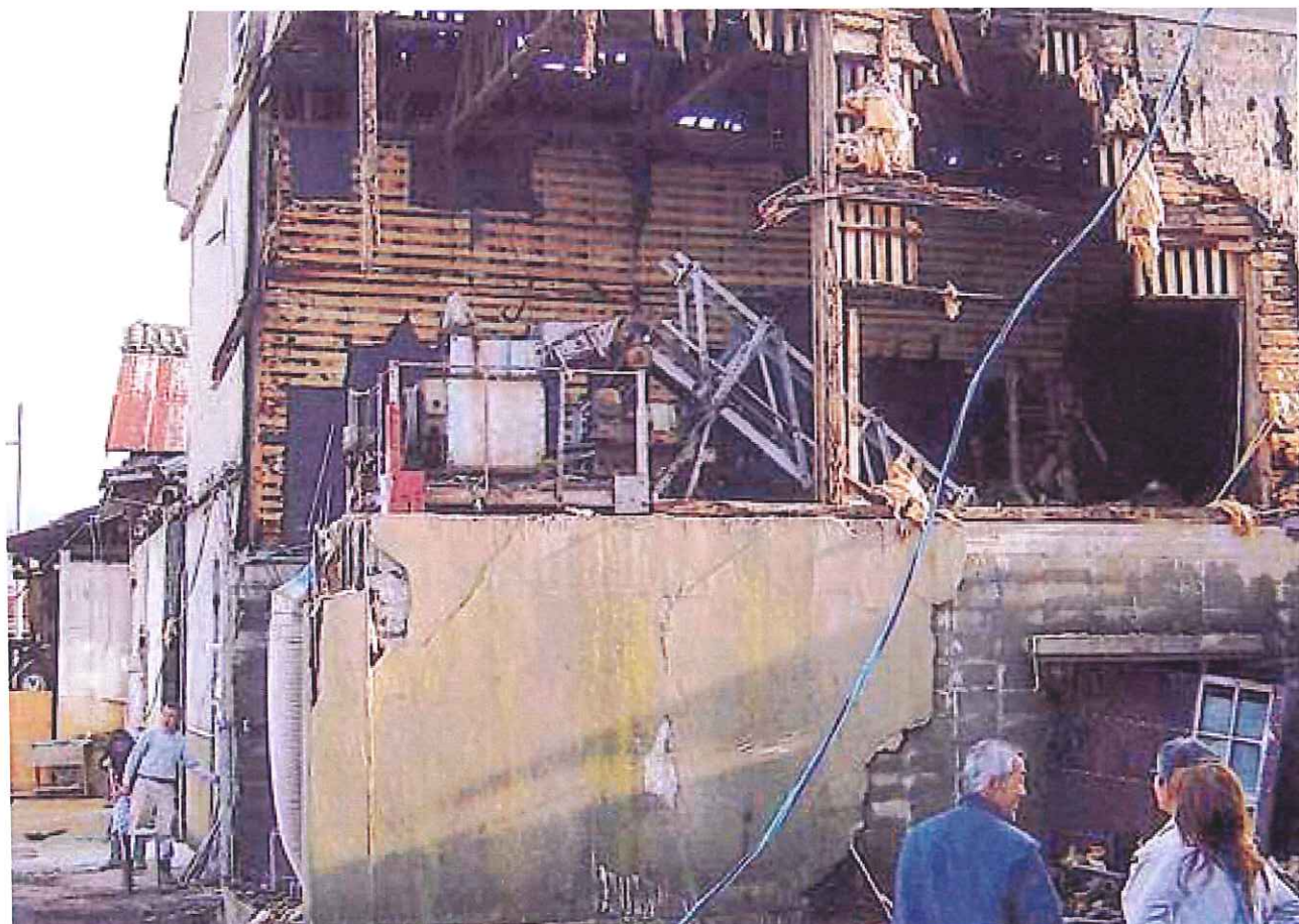
北田辺地区(10月21日、舞鶴市北田辺)