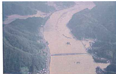
舞鶴市岡田由里・桑飼上付近