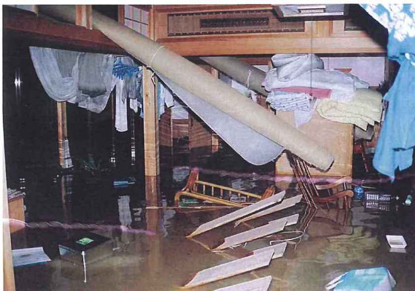
浸水した自宅内部の様子(福知山市上天津)

洪水の激流や土砂にのみ込まれ、多くの家屋が全半壊となり大きな被害を受けました。さらに停電や断水も続き、住民の日常生活に深刻な影響を与えました。町役場や一部の公民館、避難所となった施設も浸水する事態となりました。