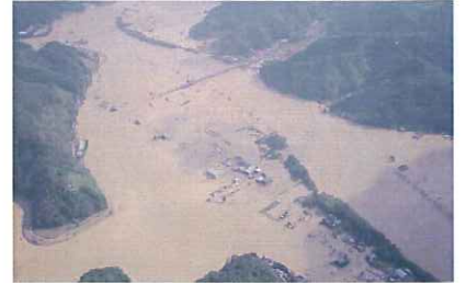
舞鶴市大川橋付近