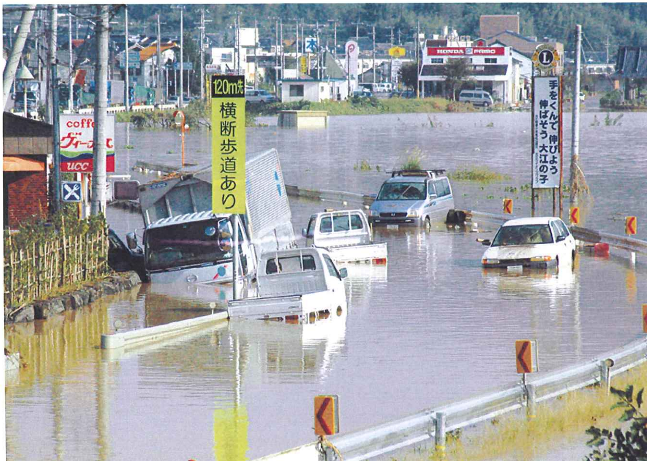
国道175号(福知山市大江町河守)

浸水や橋の崩落、土砂災害により、多くの生活道路が通行止めとなりました。公共交通機関でもJR山陰本線や北近畿タンゴ鉄道などが不通になり、高速道路では通行規制がつづきました。