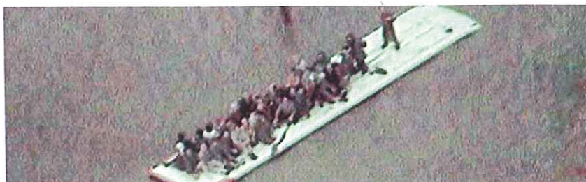
志高地区(舞鶴市志高)