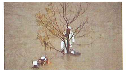
志高地区(舞鶴市志高)