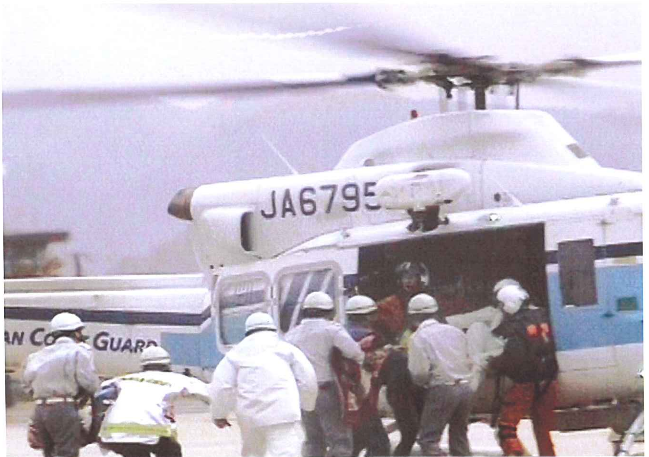
志高地区(舞鶴市志高)

自衛隊、海上保安庁、京都府警のヘリコプターやボートが、孤立した住民などを救助しました。被災者は自宅2階や避難所などで、不安な一夜を過ごしました。