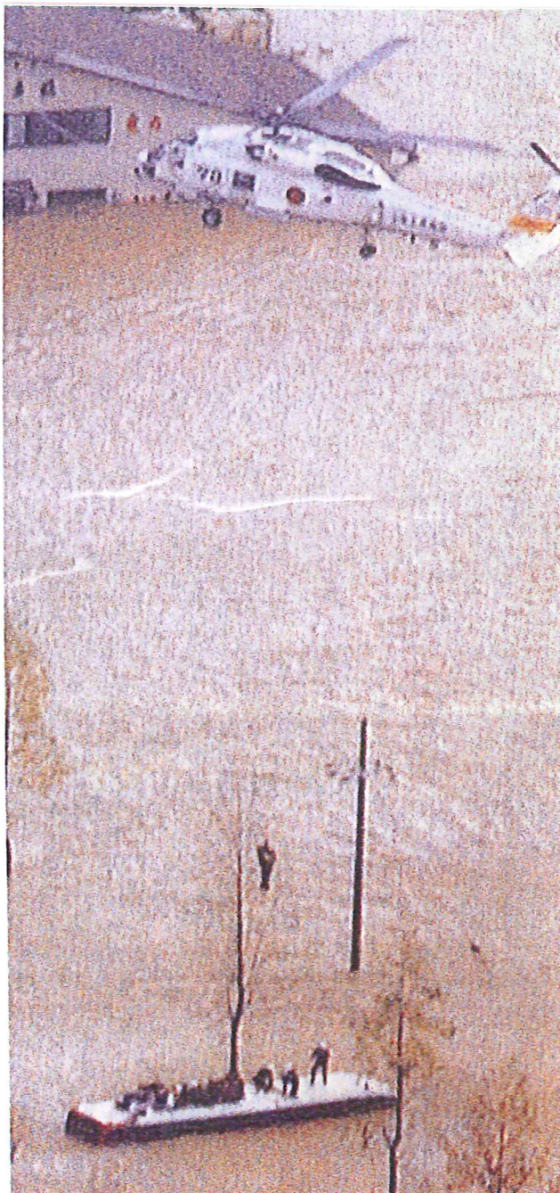
由良川からあふれた水で立ち往生したバス乗客の救出作業 (21日午前7時43分、京都府舞鶴市志高)