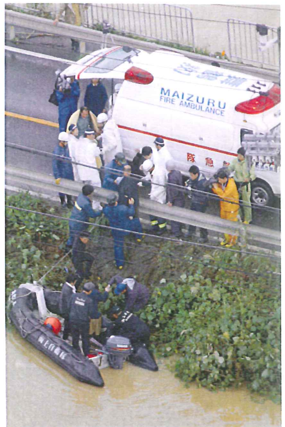
取り残された住民を救出し、救急車に運び込む 自衛隊員ら(21日午前8時30分)