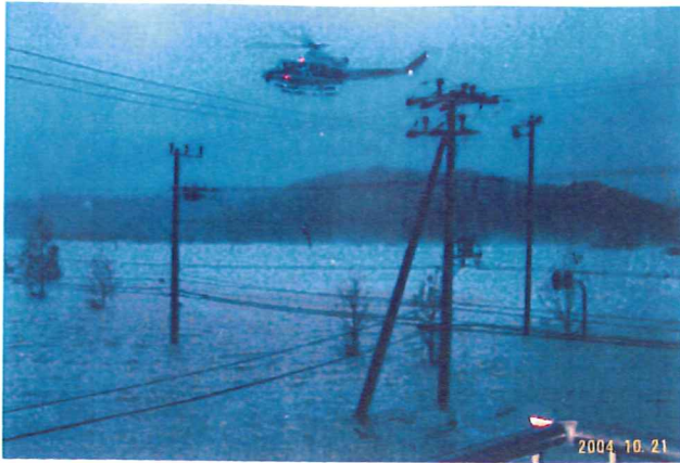
明方に飛ぶ救助用のヘリコプター(舞鶴市志高)