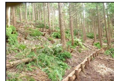
【治山：保安林整備(丸太筋工)】