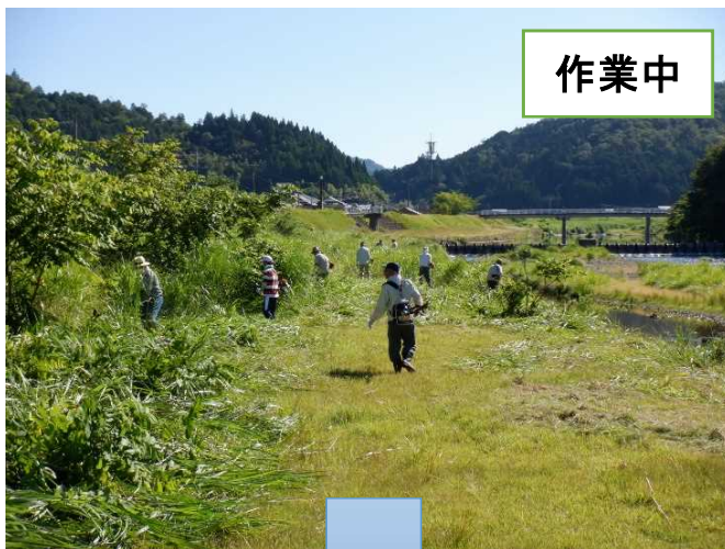
【奥上林地区(睦寄町志古田橋付近)】