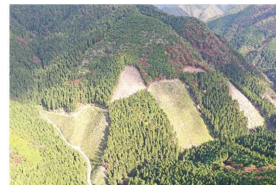
育成複層林（南丹市）