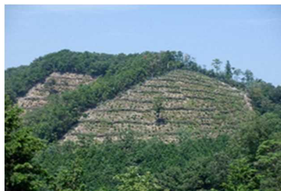
針広混交林（京丹波町）