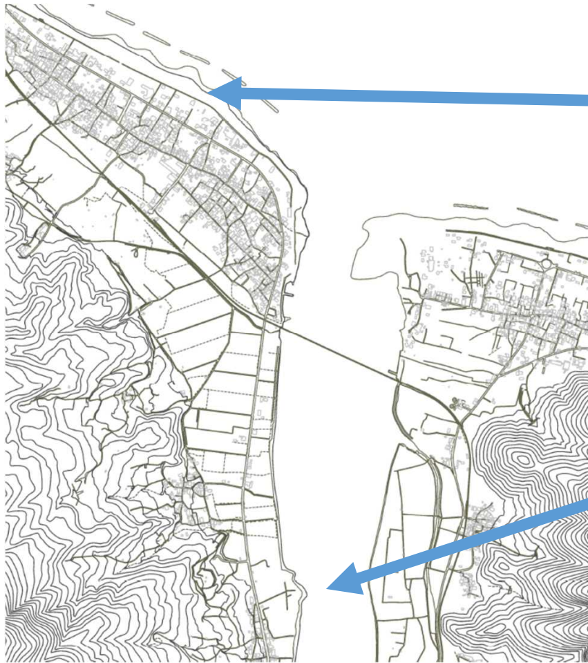
【由良海岸の漂着ごみ】