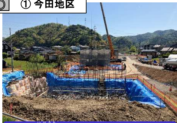
池内川橋(仮称)の下部工事の施工を行っています。