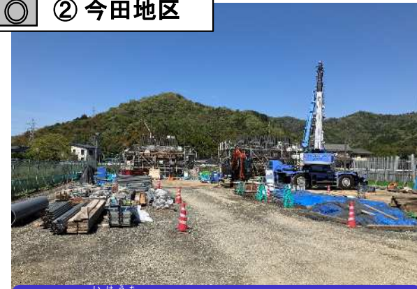
池内川橋(仮称)の下部工事の施工を行っています。