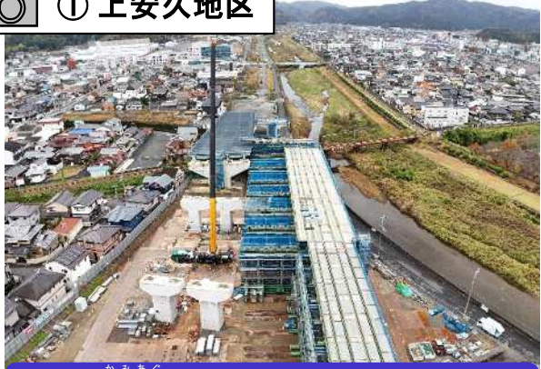
上安久高架橋(仮称)の上部工事の施工を行っています。