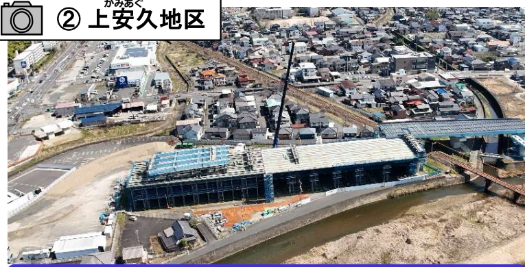
上安久高架橋(仮称)の上部工事の施工を行っています。