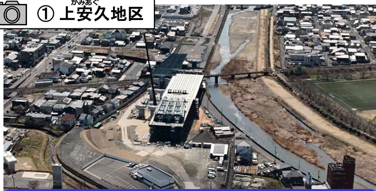
上安久高架橋(仮称)の上部工事の施工を行っています。