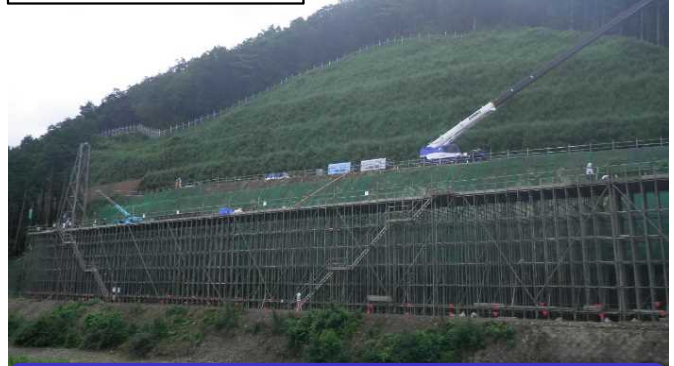
よう壁をつくるための足場を作っています