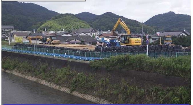
盛土の重みにより地面を締め固めています