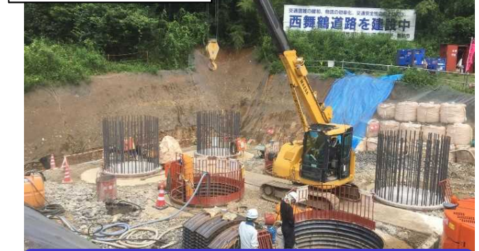
橋台をつくるための基礎をつくっています