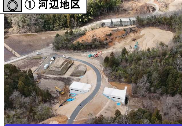
地盤改良と工事用道路の造成を行いました。