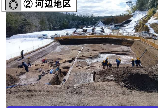
また、松田城跡の埋蔵文化財調査を行っています。