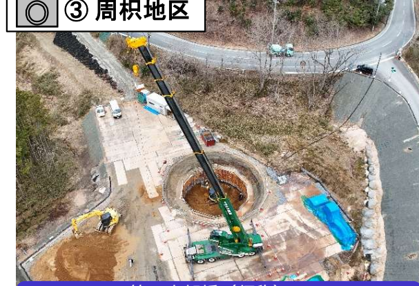
第二高架橋(仮称)の基礎の施工を行っています。