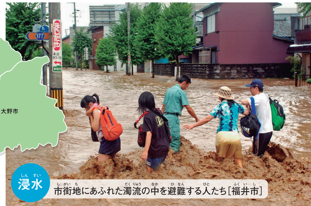
浸水 市街地にあふれた濁流の中を避難する人たち[福井市]