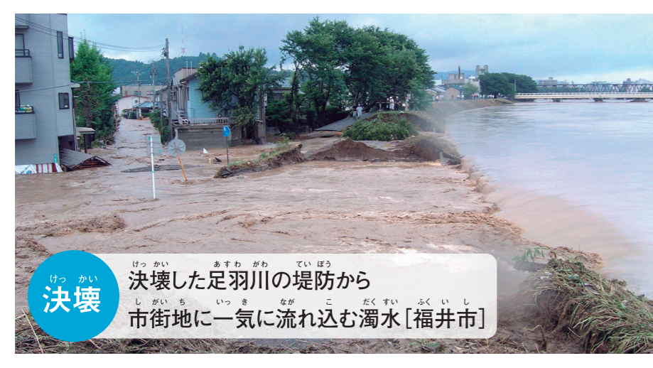
決壊 決壊した足羽川の堤防から市街地に一気に流れ込む濁水[福井市]