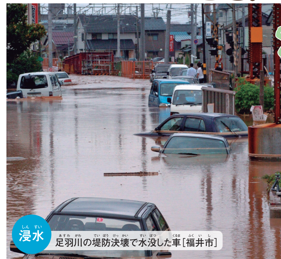
浸水 足羽川の堤防決壊で水没した車[福井市]