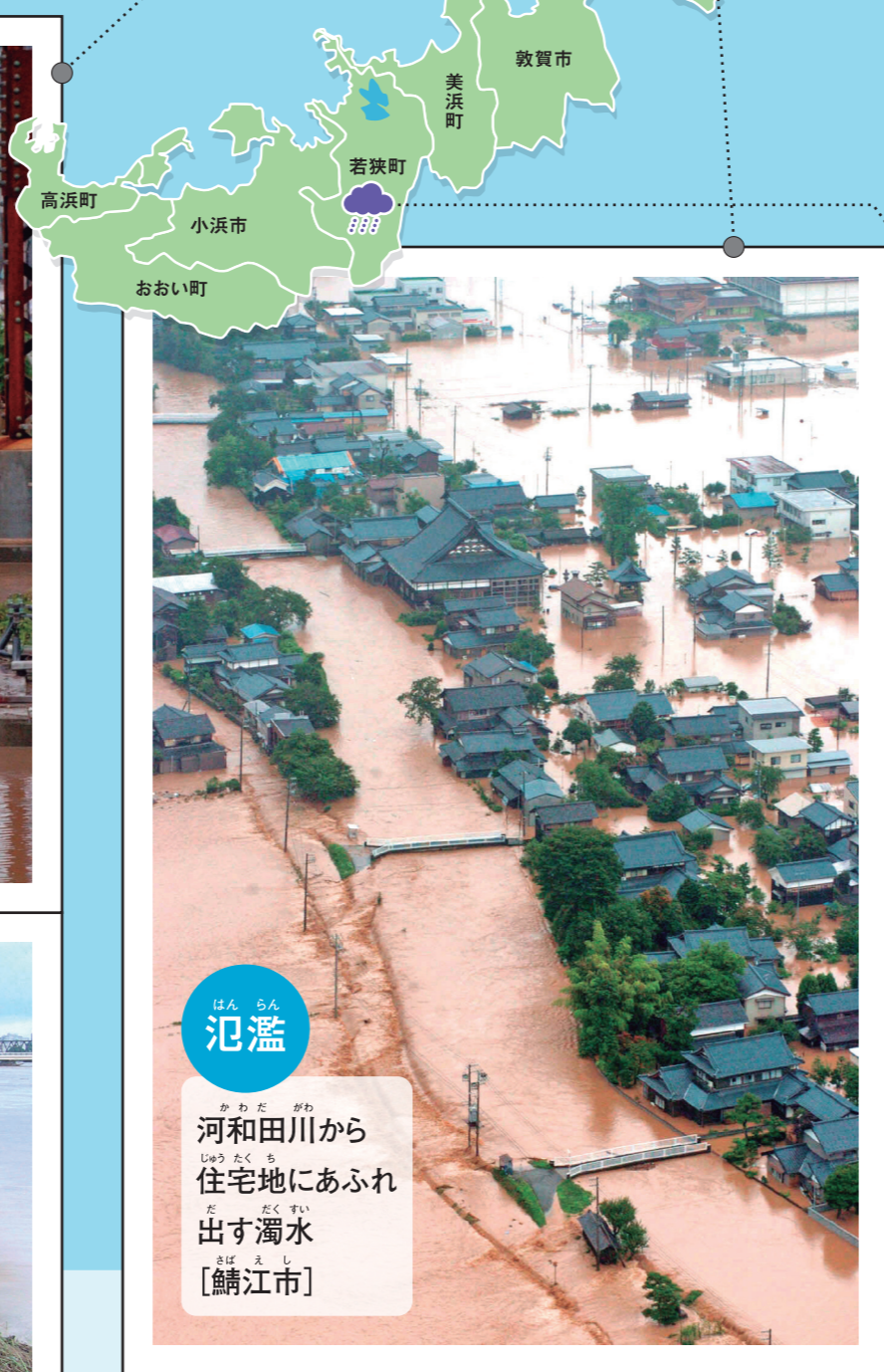
氾濫 河和田川から住宅地にあふれ出す濁水[鯖江市]