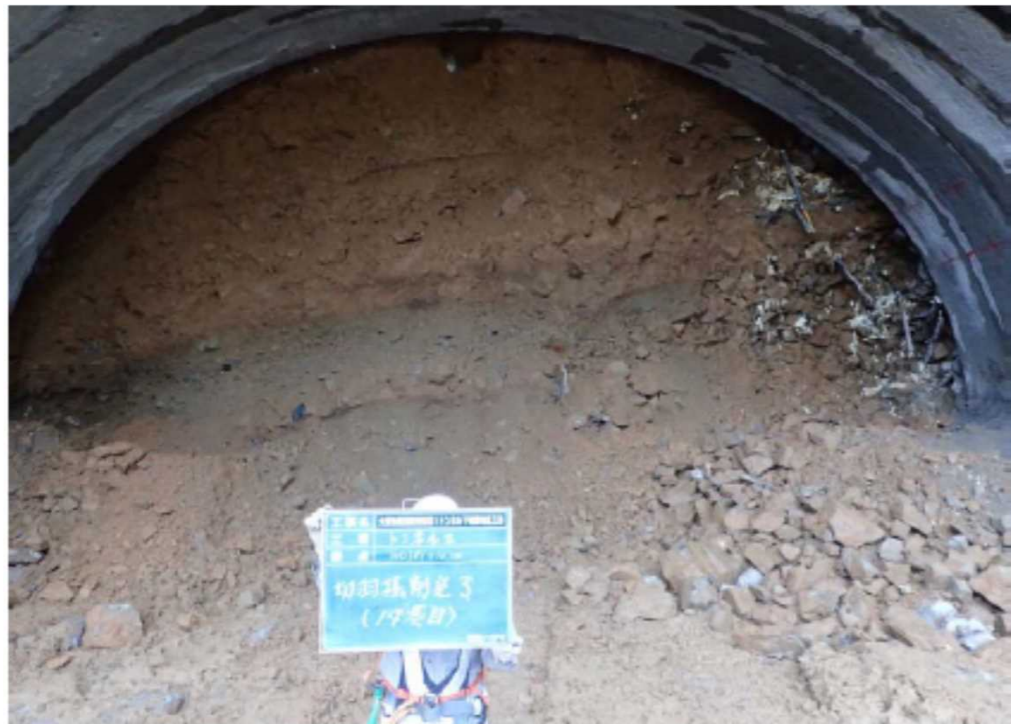
荒島第1トンネル(仮称)は、平成29年10月12日、掘削に着手しました。