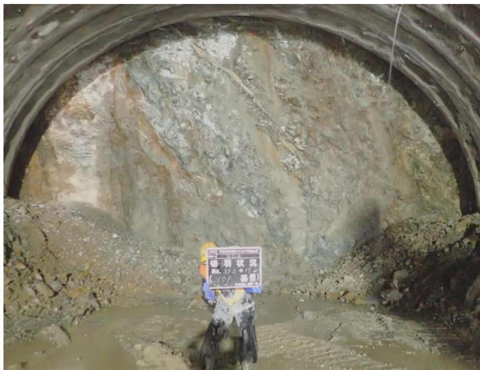
※荒島第1トンネル（仮称）は、平成29年10月12日、掘削に着手しました。