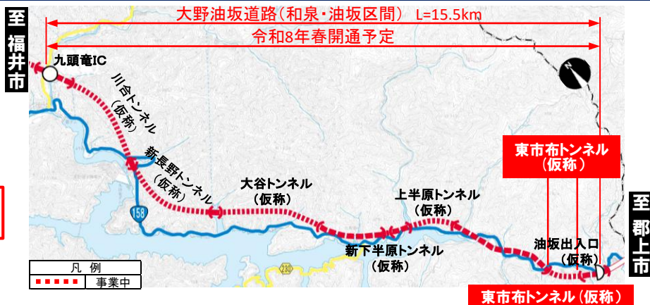
大野油坂道路（和泉・油坂区間）工事状況