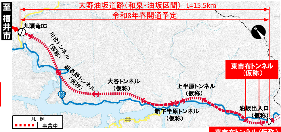
大野油坂道路（和泉・油坂区間）工事状況