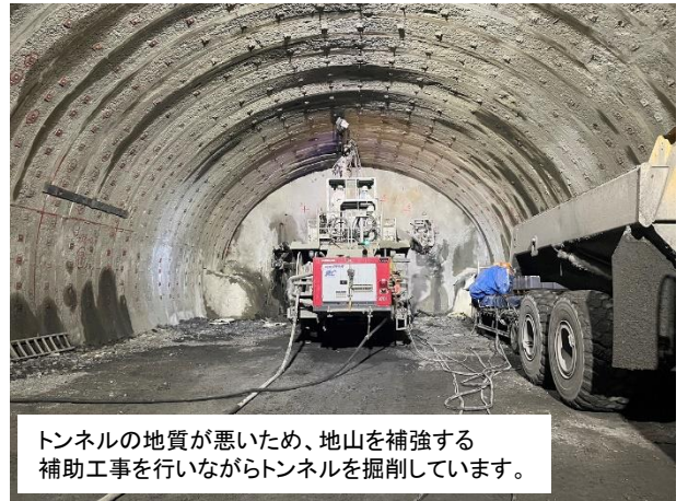
トンネルの地質が悪いため、地山を補強する補助工事を行いながらトンネルを掘削しています。