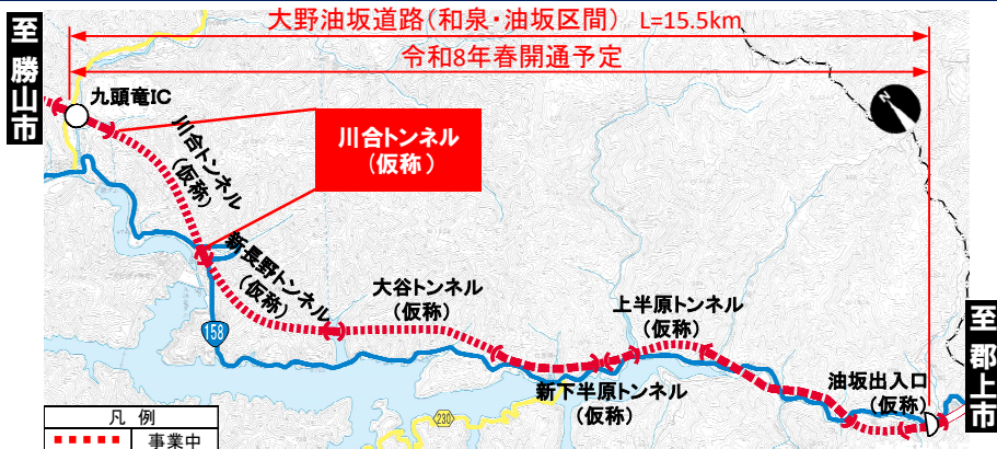
大野油坂道路（和泉・油坂区間）工事状況