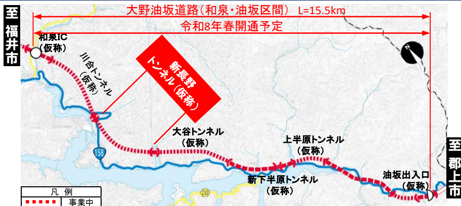
大野油坂道路（和泉・油坂区間）工事状況