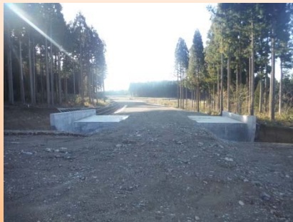
写真-④:大野東IC橋(仮称)