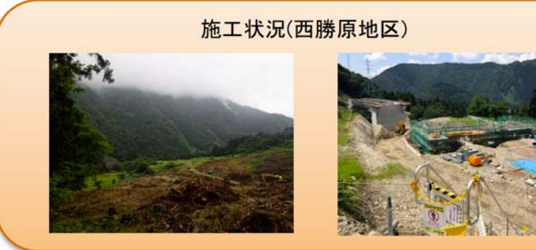
写真-④ 西勝原地先 ■付け替え国道部の除草・伐採工を進めています。(写真 左) ■横断函渠の施工を進めています。(写真 右)

写真-③ 下山地先 ■P1橋脚 鋼矢板の仮締切工事を進めています。 掘削工事を進めています。((3m/8m)完了) ■河川部分 P1橋脚の施工に伴う河川の掘削工事を進めています。