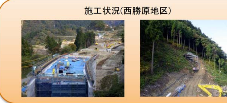
写真-④ 西勝原地先 ■白谷川橋の床版コンクリートの打設が完了しました。今後、高欄の施工を進めます。(写真 左) ■トンネル坑口部の法面工事を進めています。(写真 右)

写真-③ 下山地先 ■P1橋脚 P1橋脚の底版部の鉄筋を組み立てています。今後、コンクリート打設を進めます。 ■P2橋脚 P2橋脚の施工を進めています。