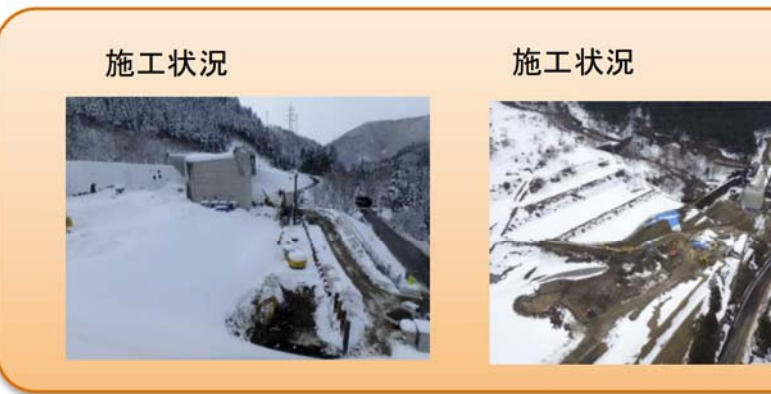
写真-③ 西勝原地区 ■荒島第一トンネル勝原坑口への進入路となる路体の土留め杭を打設しています。 (写真左の右側部分) ■林道の付け替え工事を進めています。 (写真右の中央部分)