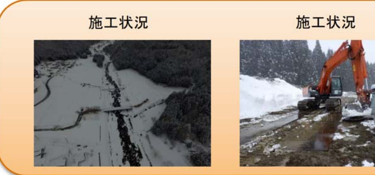
写真-④ 貝皿地区 ■除雪作業をしながら、作業ヤードの整備を進めています。

写真-③ 西勝原地区 ■荒島第一トンネル勝原坑口への進入路となる路体の土留め杭を打設しています。 (写真左の右側部分) ■林道の付け替え工事を進めています。 (写真右の中央部分)