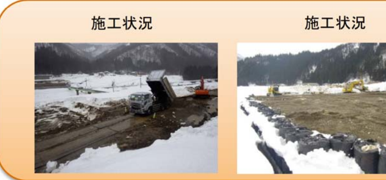
写真-④ 貝皿地区 ■除雪作業をしながら、作業ヤードの整備を進めています。

写真-③ 西勝原地区 ■荒島第一トンネル勝原坑口部の地盤改良を行うため、除雪作業を進めています。(写真左) ■林道付け替え部にて、除雪作業を進めています。(写真右の中央部分)