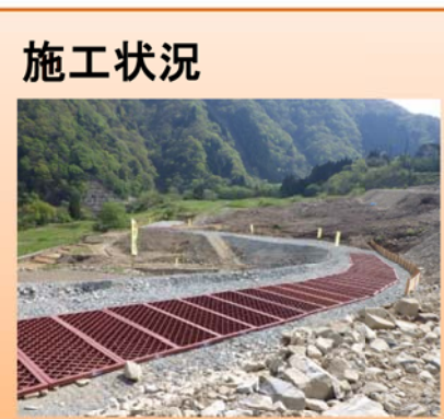
写真-③ 西勝原地区 ■荒島第一トンネル勝原坑口部の地盤改良を行っています。(写真左) ■林道の付け替え部にて、盛土を行っています。(写真右)