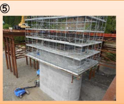
写真-⑤ 下山地区 ・橋梁下部の橋脚の施工を行っています。