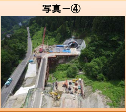
写真-③ 蕨生地区 かんきょ ・函渠工事を行っています。 写真-④ 下唯野地区 ・橋梁下部工事を行っています。