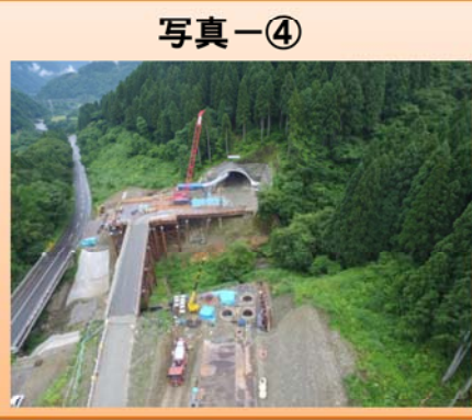
写真-③ 蕨生地区 かんきょ ・函渠工事を行っています。 写真-④ 下唯野地区 ・橋梁下部工事を行っています。