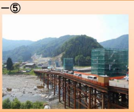
写真-⑤ 下山地区 ・橋梁下部の橋台、橋脚の施工を行っています。