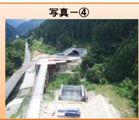
写真-③ 蕨生地区 ・かんきょ ・函渠工事をを行っています。 写真-④ 下唯野地区 ・橋梁下部工事をを行っています。