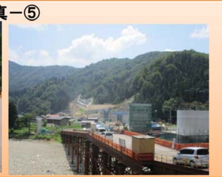
写真-⑤ 下山地区 ・橋梁下部工事をを行っています。